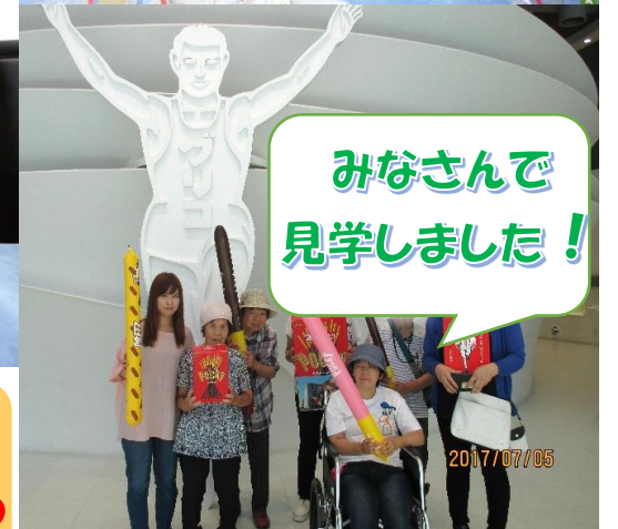
みなさんで見学しました！