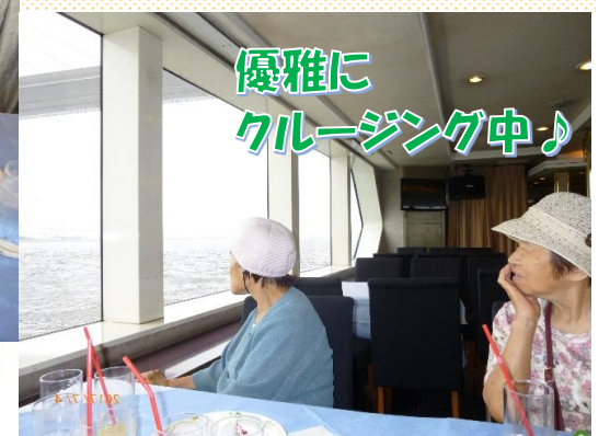
優雅にクルージング中♪