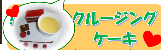
クルージングケーキ♡