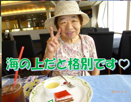
海の上だと格別です♡