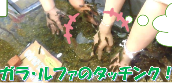
ガラ・ルファのタッチング！