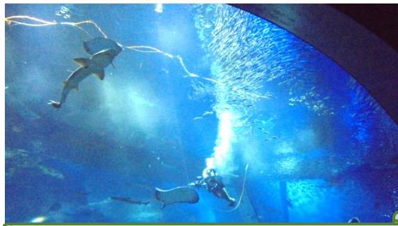
アクアワールド大洗